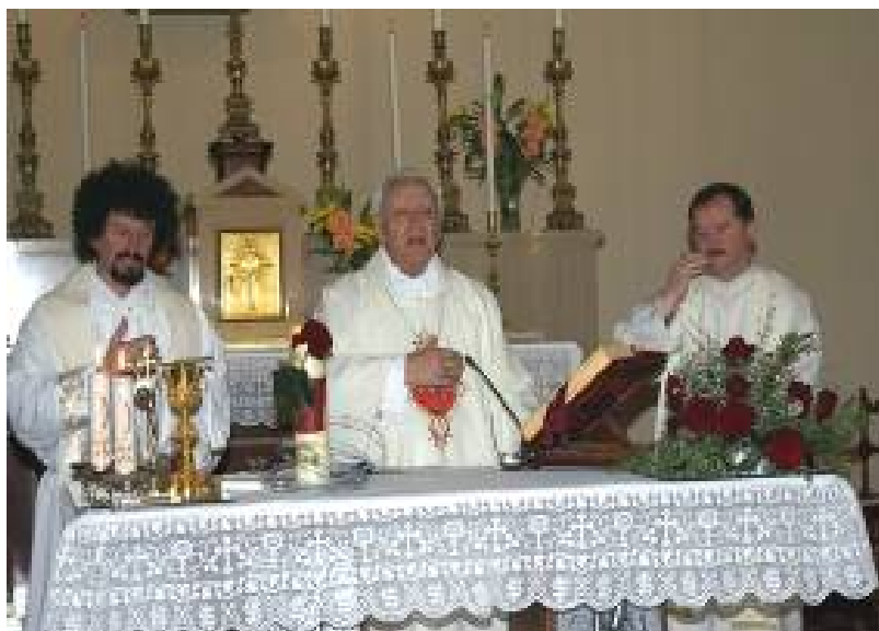
Eucharistiefeier der geistlichen Beiräte von pax christi Italien und Würzburg mit Bischof Bettazzi

Nach der Ankunft auf dem Monte Sole gab die pax christi Gruppe Bologna einführende Informationen zur Geschichte des Monte Sole, über die Hintergründe der durch Einheiten der SS (16. SS-Panzergrenadier-Division „Reichsführer SS“) und der Wehrmacht in der Region um Marzabotto verübten, angeblich gegen