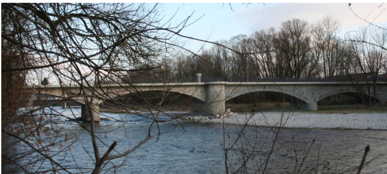
Die alte Isarbrücke aus dem 19. Jahrhundert spielte für pax christi eine wichtige Rolle als Ausgangspunkt von Friedensdemonstrationen in den 1980er Jahren.

oder durch Vorsätze, die wir anderen nahe legen. Sie entfalten sich vielmehr, so unsere Intention, durch Erzählen und Aufzeigen und In – Bewegung - bringen: „Komm, geh mit und schau...“ Daraus wird unversehens eine „reality show“ mit sinnlichen Qualitäten. Denn die Augen bekommen was zu sehen, die Ohren was zu hören. Die Orte