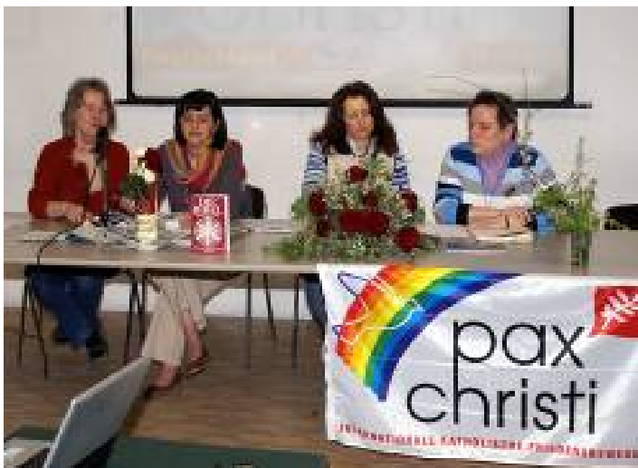
Diskussionsforum im Pfarrheim von Vado

Abschließend feierte die Gruppe in der Kirche der Dossettianerinnen eine Messe mit Bischof Luigi Bettazzi. Die auf Guiseppe Dossetti (1913-1996) zurückgehende Bologneser Kongregation gründete auf dem Monte Sole eine Niederlassung, mit der Intention, die Stätte des Grauens in einen Ort des Gebets zu verwandeln. - Schwester Teresa informierte über die Idee, Geschichte und Lebensweise der Dossettianer und Dossettianerinnen; Monsignore Luigi Bettazzi, ein Freund Dossettis, verdeutlichte in einem eindrucksvollen Vortrag die Vielseitigkeit und Bedeutung dieses Mannes. Der Jurist und Priester war nicht nur Vizesekretär der „Democrazia cristiana“ und einer der Väter der italienischen Verfassung gewesen; er prägte auch das II. Vatikanische Konzil maßgeblich mit seinen weitreichenden Überlegungen zur Geschäftsordnung und die Diözese Bologna als Generalvikar.